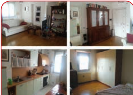
VENDESI Appartamento 80 mq circa C.D.B. Via Mameli Pesaro, piano alto, posto auto condominiale, 2 camere da letto (1 con balcone) salone, cucina, bagno con vasca, ripostiglio con doccia. Euro 180.000 (APE E 128,9 kwh m2anno) info 3381295076

VENDO Skoda Fabia City 1958cc, diesel, uniproprietario, GENNAIO 2004, grigio chiaro metallizzato, Km 270.000 reali, tagliandi regolari documentabili, condizioni ottime, gomme nuove, catene neve, ABS, airbag, climatizzatore, servosterzo, chiusura centralizzata, vetri elettrici, autoradio, lettore CD, immobilizzatore, fendineb-