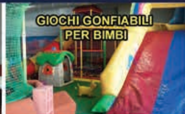
GIOCHI GONFIABILI PER BIMBI