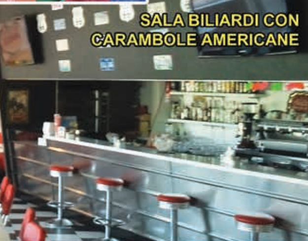
SALA BILIARDI CON CARAMBOLE AMERICANE