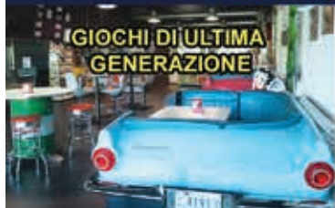
GIUCHI DI ULTIMA GENERAZIONE

...E PER LE VOSTRE FESTE LA SALA PIU' DIVERTENTE DI PESARO!!!