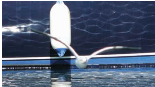
moio&sivelli, like a seagull , video still, 2014

Durante il periodo della mostra, negli spazi della chiesa del Suffragio, verrà inoltre proiettato il film