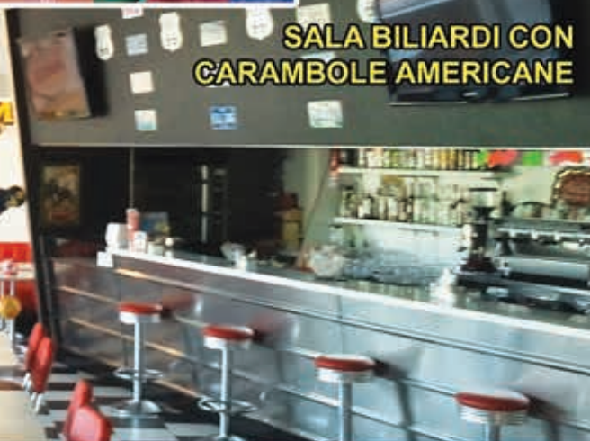
SALA BILIARDI CON CARAMBOLE AMERICANE