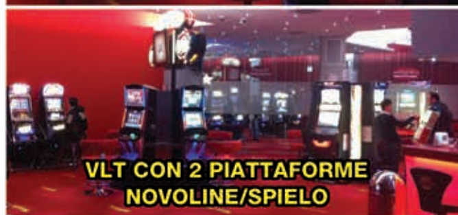
VLT CON 2 PIATTAFORME NOVOLINE/SPIELO

Pesaro - Piazzale Stefanini, 27 (zona BPA Palas) sotto cinema 6 sale UCI