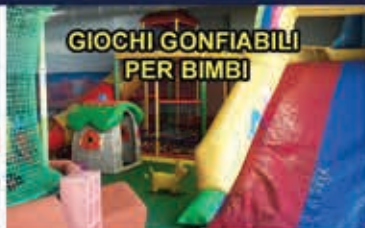
GIOCHI GONFIABILI PER BIMBI