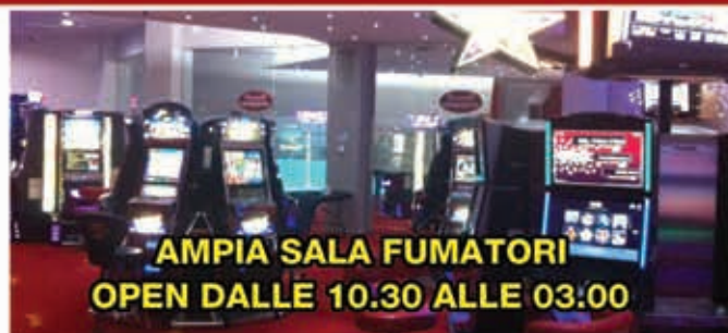
AMPIA SALA FUMATORI OPEN DALLE 10.30 ALLE 03.00

3 DIVERSI TIPI DI JACKPOT FINO A 500.000 EURO!!!