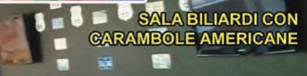
SALA BILIARDI CON CARAMBOLE AMERICANE