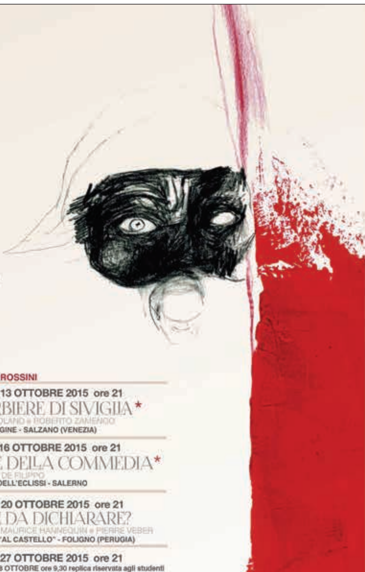
Disegno di Renato Barilli