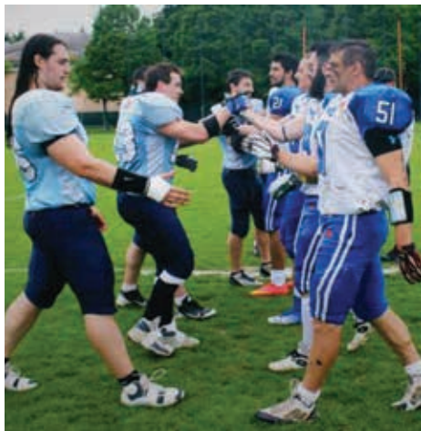
Nella foto i Titans Forlì e gli Angels Pesaro nel saluto della prima gara

Parte il conto alla rovescia per i Ranocchi Angels, infatti il 3 ottobre comincia il campionato nazionale giovanile under 19. I ragazzi si stanno allenando duramente per essere preparati al primo incontro, che avverrà proprio contro i "cugini" dei Dolphins Ancona. Tante le novità da segnalare nel settore giovanile, prima fra tutte la temporanea fusione con i ragazzi dei Titans di Forlì, per avere un gruppo più numeroso e competitivo di atleti. L'unione tra le