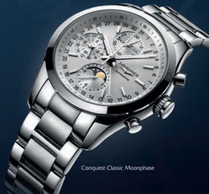
Conquest Classic Moonphase