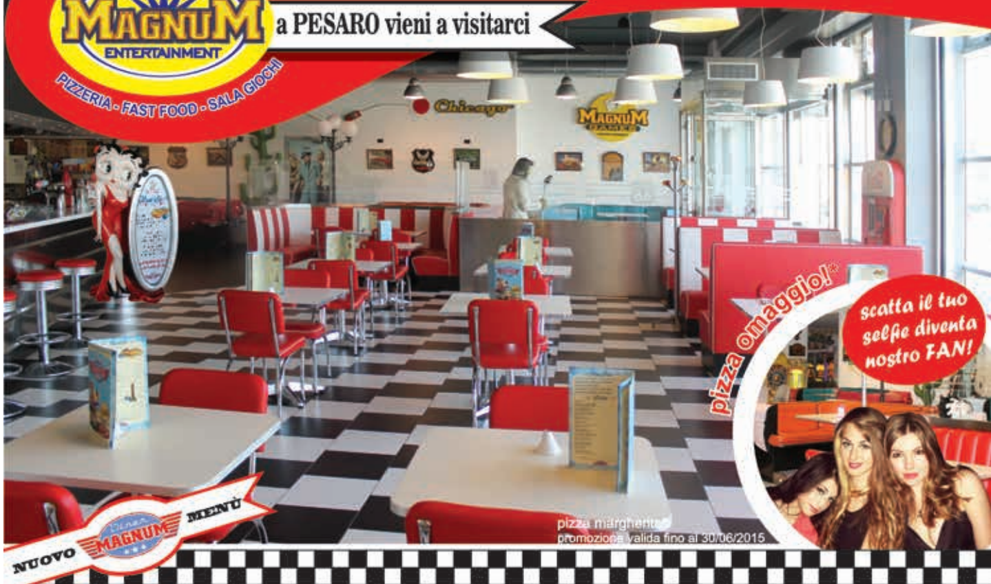
pizza margherita promozione valida fino al 30/06/2015