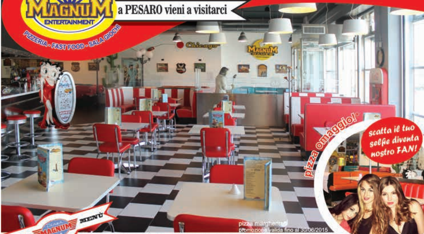
pizza margherita promozione valida fino al 30/06/2015