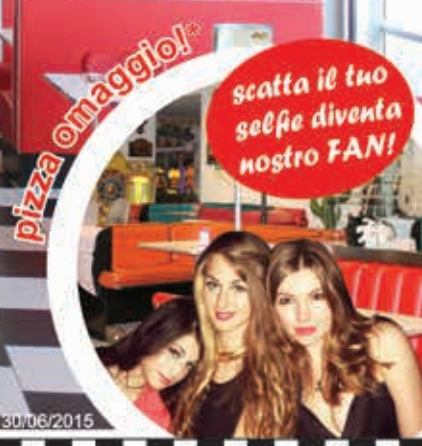
pizza margherita promozione valida fino al 30/06/2015