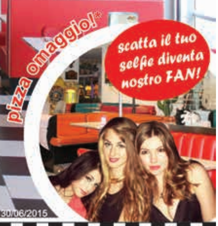
pizza margherita promozione valida fino al 30/06/2015